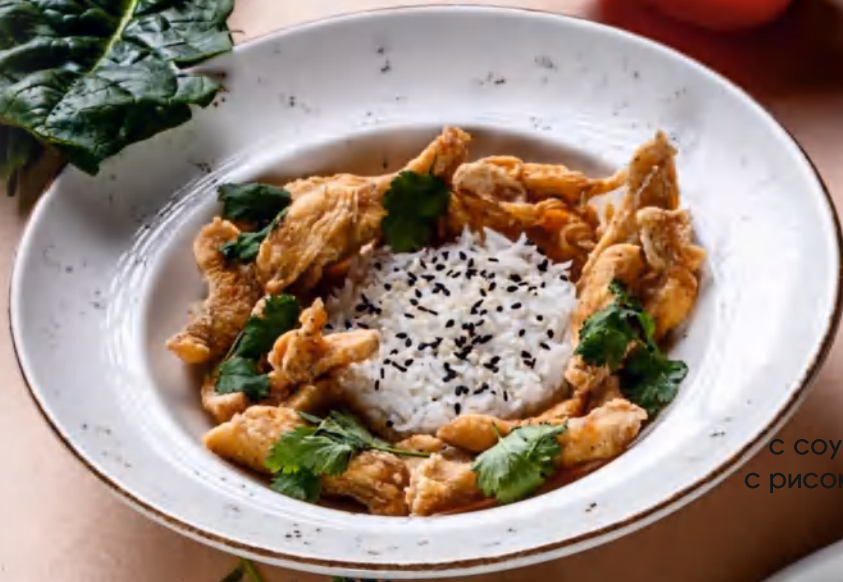
Курица с соусом том ям с рисом басмати