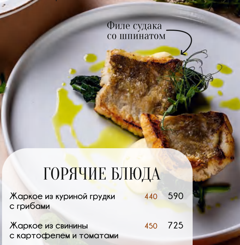
Филе судака со шпинатом