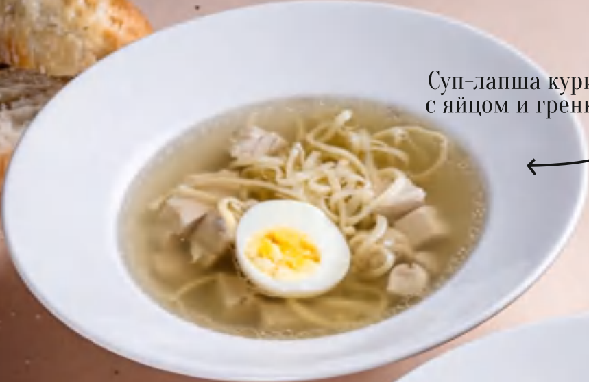
Суп-лапша куриная с яйцом и гренками