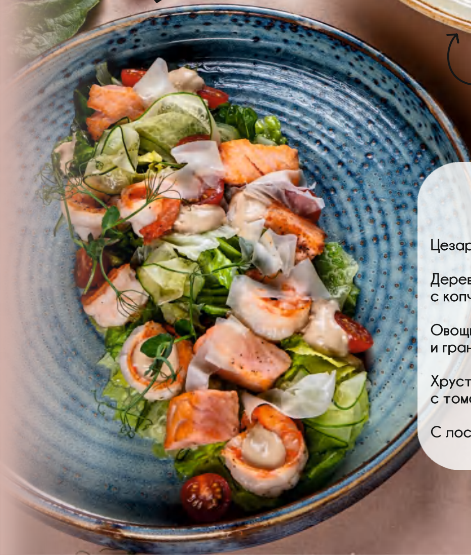
Салат с лососем и креветками