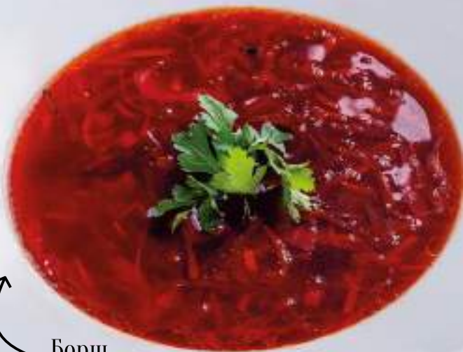
Борщ с говядиной