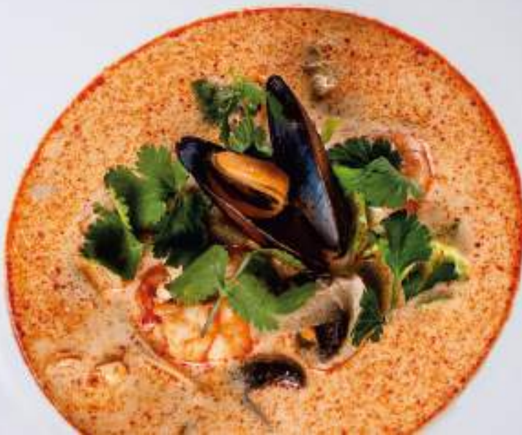
Суп с морепродуктами в азиатском стиле